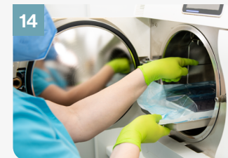
14 Mettre dans le stérilisateur