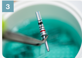
3 Placer tous les forets dans le liquide de nettoyage