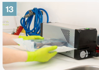
13 Fermer le sachet de manière étanche