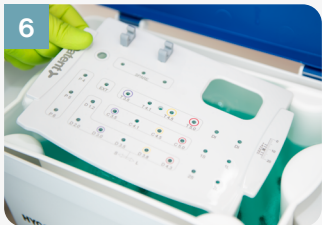
6 Mettre le couvercle dans le liquide