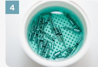
4 Placer également le bol en métal dans le liquide