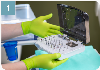
1 Apporter la trousse chirurgicale à la stérilisation