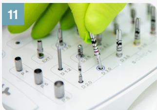
11 Replacer toutes les pièces dans la trousse chirurgicale