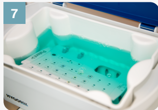
7 Le couvercle doit être recouvert de liquide