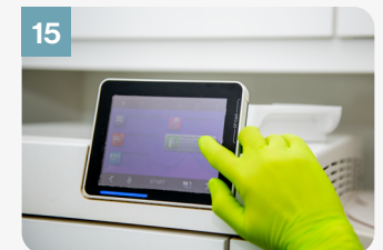
15 Démarrer le programme de stérilisation